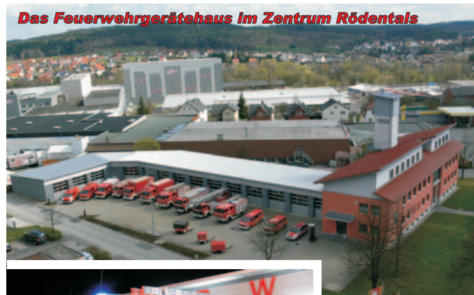
Das Feuerwehrrätehaus im Zentrum Rödental

Weitere Informationen und aktuelles über die Freiwillige Feuerwehr Rödental finden Sie auch im Internet unter www.ff-roedental.de